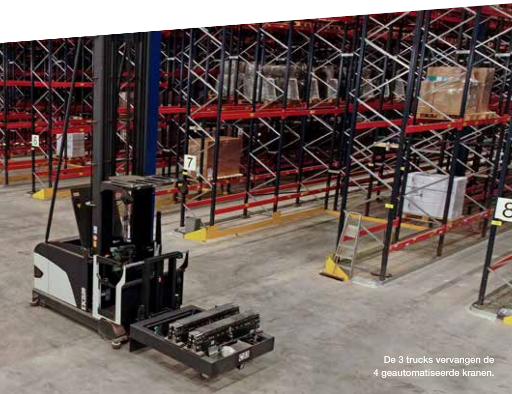
De 3 trucks vervangen de 4 geautomatiseerde kranen.

diverse redenen kregen we het pand niet goed gevuld”, vervolgt Van Zwieten. Er zat alleen een sprinklerinstallatie vlak onder het dak, waardoor niet alle goederen in dit magazijn konden worden opgeslagen. Boxsprings of andere artikelen waar schuimstof in verwerkt is, konden wij hier niet opslaan. Daarnaast bleek de automatisering te beperkend voor de palletmatten: naast blokpallets en europallets gebruikt Leen Bakker de zogeheten DC2-pallets. Deze pallets met een afmeting van 2,00 x 1,20 meter konden niet gehandeld worden, bovendien