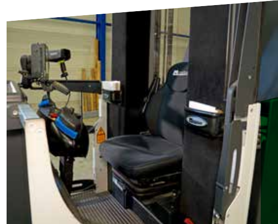
Keuze viel op bemande smalle gangen trucks.

Om de bezettingsgraad te verbeteren, ging Leen Bakker op zoek naar een passende oplossing. Randvoorwaarde was, dat de stellingen niet verplaatst mochten worden. “De staanders zijn ondersabeld met mortel, in het bovenste gedeelte